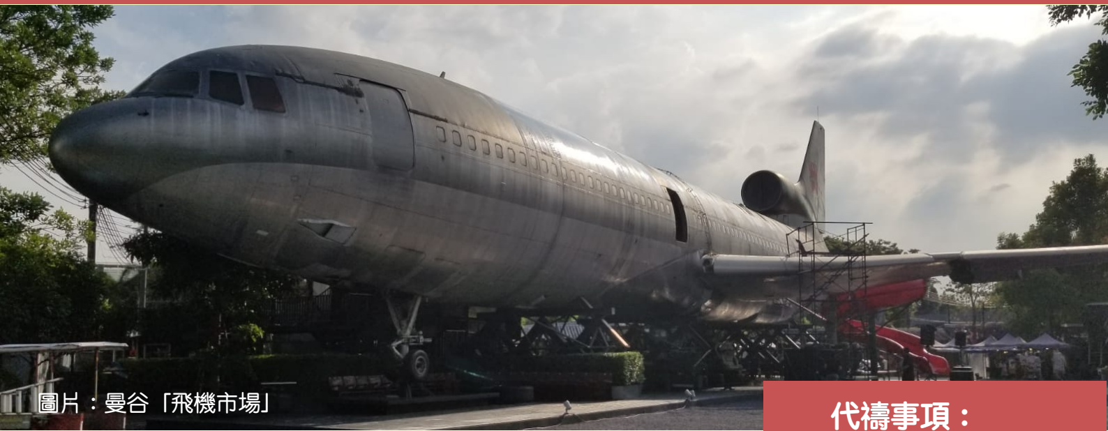
圖片：曼谷「飛機市場」

過程中，手物夫婦發覺聾人翻譯員常會問一些「意想不到」的問題：耶穌在充滿大浪的海面上走向門徒時，耶穌是否隨著波浪的高高低低在「升降」？保羅還願後「剃頭」，他是完全禿頭、「刮青」、還是短髮？這些問題都反映出手語與文字的差異：前者是一個很圖象化的語言，後者則可以有很多留白或想象空間。由於特性不一，自然就會關注經文不同的重點。在這方面，手物夫婦真需要多加學習和留意，也需求主賜下加倍的智慧。